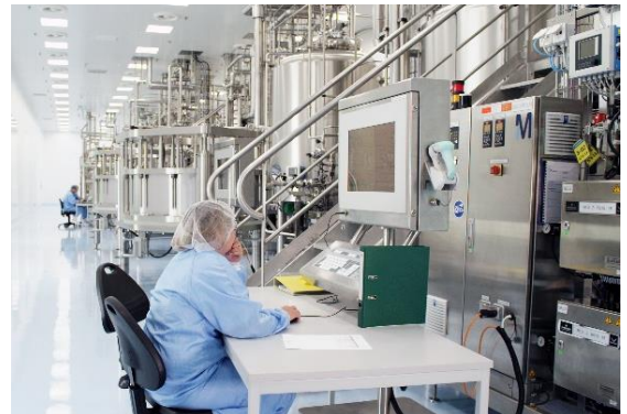
Bioreactors bij UCB in Bulle

Momenteel is er nog één bedrijf dat een product klaar heeft voor klinische studies. Aangezien dat bij een dergelijk geneesmiddel jaren in beslag neemt, verwacht dit bedrijf dat het niet voor eind 2026 op de markt komt. UCB kan daarom minimaal twee jaar extra profiteren van een verdere groei van de omzet in Cimzia.