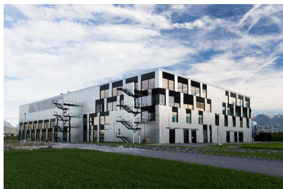
UCB biopharmafabriek in Bulle

UCB heeft sinds 2015 een aanzienlijke daling van zijn uitstoot aan broeikasgassen, watergebruik en afvalvermindering laten zien. Dat geeft aan dat het op weg is om zijn doelen te halen.