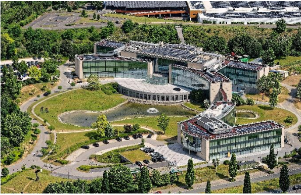
UCB Hoofdkantoor ten zuiden van Brussel

Dankzij het succes van Nootropil kon UCB een moderne farmaceutische vestiging bouwen in Eigenbrakel, ten zuiden van Brussel.